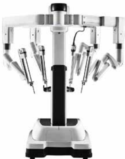
Robot da Vinci Xi® : le chariot patient avec ses 4 bras reliés aux instruments de haute précision