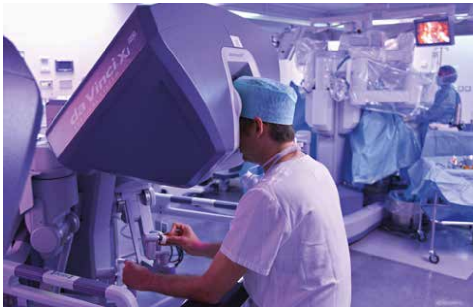
Le médecin urologue aux commandes du robot da Vinci Xi®