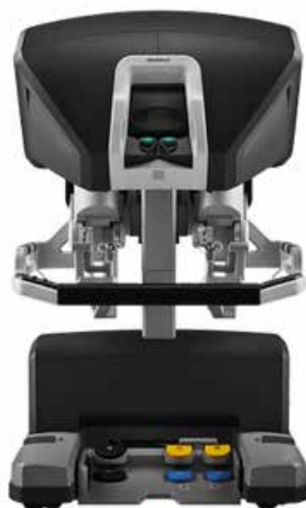
Robot da Vinci Xi® : la console du chirurgien avec vision tridimensionnelle et ses 2 manettes pour contrôler les bras et instruments du robot