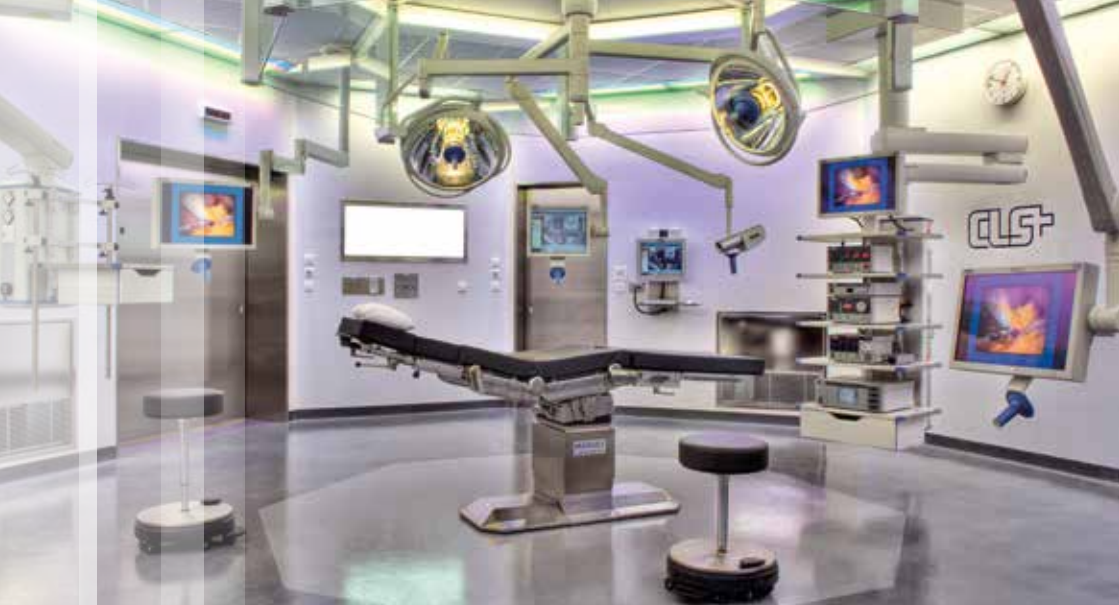
Bloc opératoire OR1